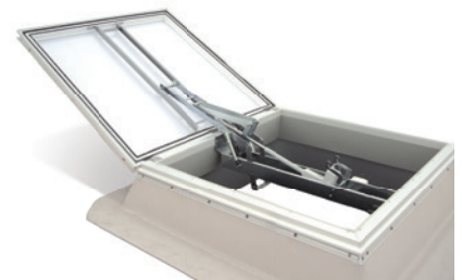
TOP-90 PLUS Lichtkuppel mit 24V RWA-Beschlag, montiert auf Aufsetzkranz

Hinweis: Umrüstung von TOP-90 auf TOP-90 PLUS ist nachträglich möglich